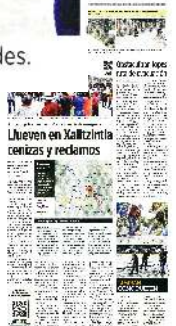
■ Pobladores se concentraron en la plaza principal para un simulacro, pero sólo hubo un acto protocolario de las autoridades.