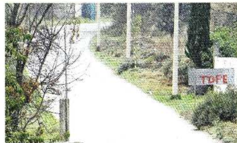
En la ruta de evacuación existen al menos 25 topes y otros daños, mientras que las calles del poblado tienen reductores de velocidad que generan riesgo ante una emergencia por "Don Goyo".