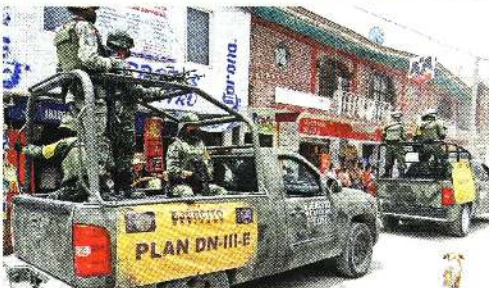
Elementos del Ejército fueron desplegados en la comunidad de Xalitzintla, la segunda más cercana al cráter del volcán.

Autoridades federales y de Puebla brindaron información a pobladores de Xalitzintla y después supervisaron la ruta de evacuación número 2 del Popocatepetl, que va de San Nicolás de los Ranchos a Cholula.