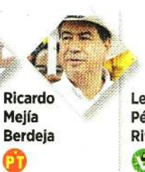
Ricardo Mejía Berdeja