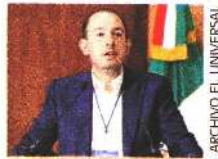
Marko Cortés, líder nacional del PAN.

A pesar de que Morena va adelantado en el proceso para la candidatura presidencial de 2024, el PRI, PAN y PRD, que presuntamente se agruparán en la alianza Va por México, no han definido las reglas para el método de selección de abanderado y, aunque el líder nacional panista Marko Cortés aseguró que se conocerán hasta después de las elecciones en el Estado de México y Coahuila, los aspirantes se impacientan. ●