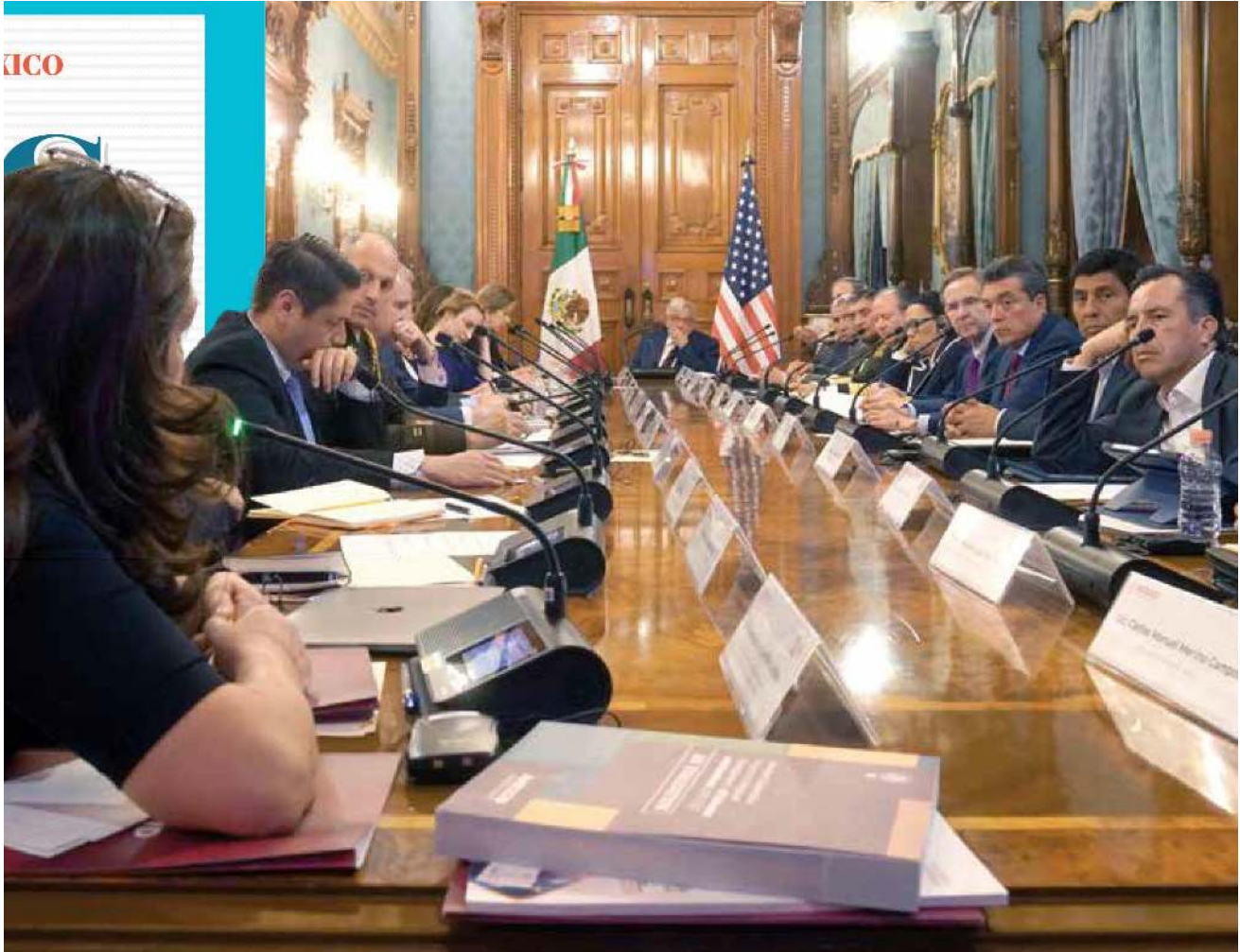
LABOR. Integrantes del Gabinete de Seguridad rindieron cuentas por primera vez ante la Comisión Bicameral del Congreso.

4 • Las Fuerzas Armadas recibieron 231 agresiones.