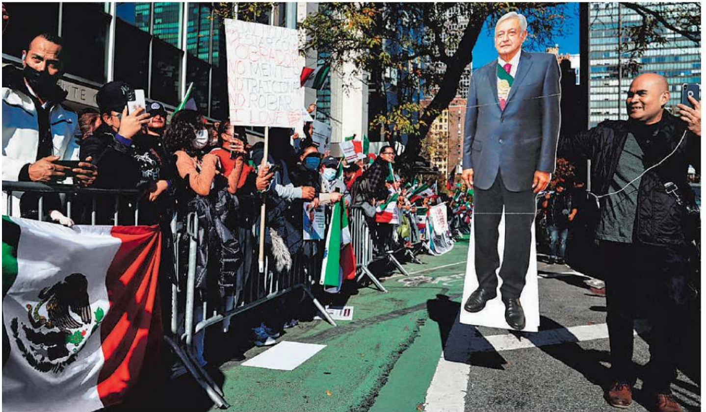
Simpatizantes mostraron su apoyo a López Obrador en el Consejo de Seguridad de las Naciones Unidas en Nueva York