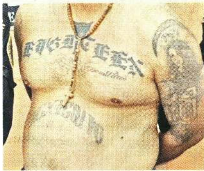
■ En el estómago tiene un tatuaje con la palabra "Mexicano".