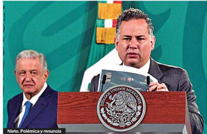
Nieto. Polémica y renuncia

En entrevista con Proceso el miércoles 10, el nuevo titular de la UIF asegura que la