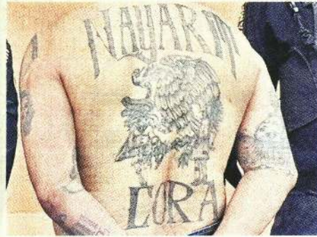
■ En la espalda tiene las palabras "Nayarit" y "Cora", así como el escudo nacional.