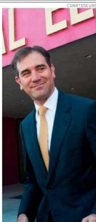
Lorenzo Córdova, en foto de archivo.

Y anunció que acudirá ante la Suprema Corte para que decida si el INE puede organizar una consulta con menos mesas de votación de las previstas en la ley de revocación de mandato aprobada por el Congreso. “Si en algún momento la revocación de mandato está en entredicho, no es responsabilidad de esta institución, sino de quien tiene la obligación de generarle a las instancias del Estado mexicano los recursos suficientes”, reprochó ●