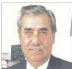
Por Humberto Mares N.

La democracia de México siempre hemos dicho que es muy cara. Miles de millones de pesos de gastan en todo el sistema democrático de nuestro país y muchas ocasiones no se presentan las cuentas claras, pero también es necesario aceptar, que hemos logrado llevar a cabo elecciones confiables y relativamente en paz social.