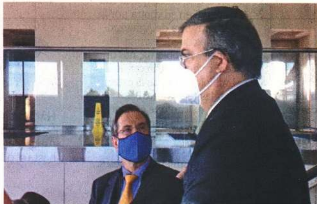
Esteban Moctezuma, embajador de México en EU, recibió a Marcelo Ebrard a su llegada al aeropuerto de Washington-Dulles.