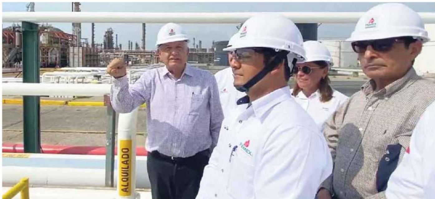
GIRA. El presidente Andrés Manuel López Obrador realizó, ayer, una visita de supervisión en la refinería de Salina Cruz, Oaxaca.