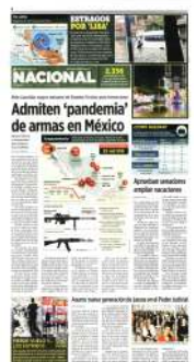
Gráfico: Iulian I. Anaya