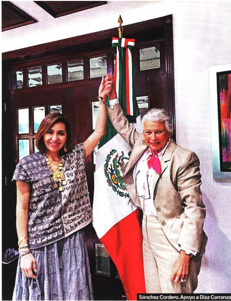
Sánchez Cordero. Apoyo a Díaz Carranza

López Obrador, desde Palacio Nacional el pasado 15 de septiembre. Ese día, el subsecretario de Seguridad Pública del gobierno federal, Ricardo Mejía Berdeja, señaló que el "Cártel del Despojo" que opera en Oaxaca no sólo involucra a supuestos dirigentes de organizaciones sociales, grupos criminales, servidores públicos, sino hasta notarios públicos.