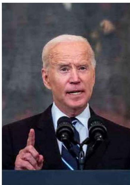
El desesperado discurso de Joe Biden para pedir el voto para su partido, el demócrata.