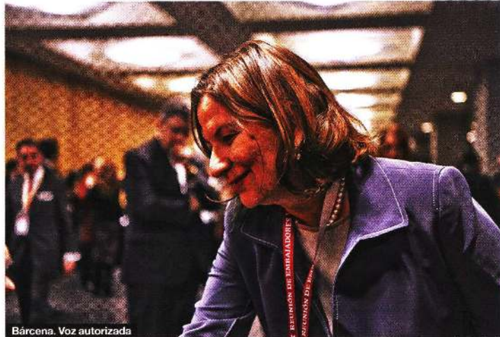
Bárcena. Voz autorizada

Así, en lugar de destacar como líder en una gran cumbre de jefes de Estado de iz-