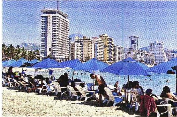
▀ Prestadores de servicios del puerto colocaron mobiliario para que los turistas empiecen a llegar a la playa.