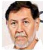
Gerardo Fernández Noroña, vocero.