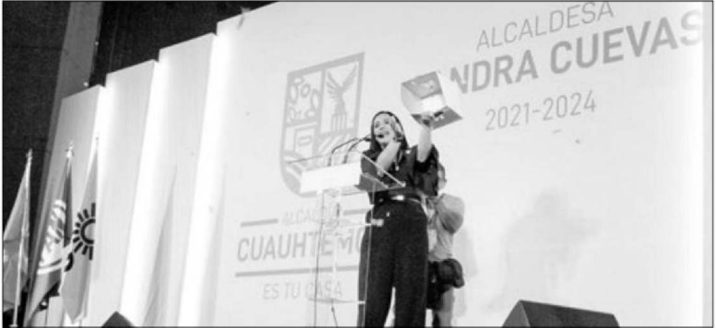
◀ El primero de octubre, Sandra Cuevas tomó posesión del cargo de alcaldesa de la demarcación Cuauhtémoc en la explanada de la alcaldía.