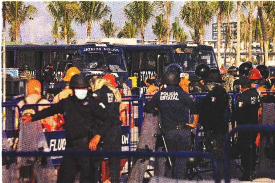
VIGILANCIA EXTREMA. Elementos antimotines y de la Secretaría de Marina resguardan los accesos a la refinería de Dos Bocas, donde el miércoles se desató un enfrentamiento.