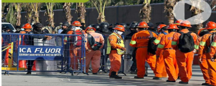
La Marina montó filtros de seguridad para supervisar el acceso de los trabajadores.