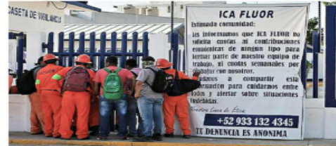
Los obreros fueron desalojados ayer tras una nueva manifestación.