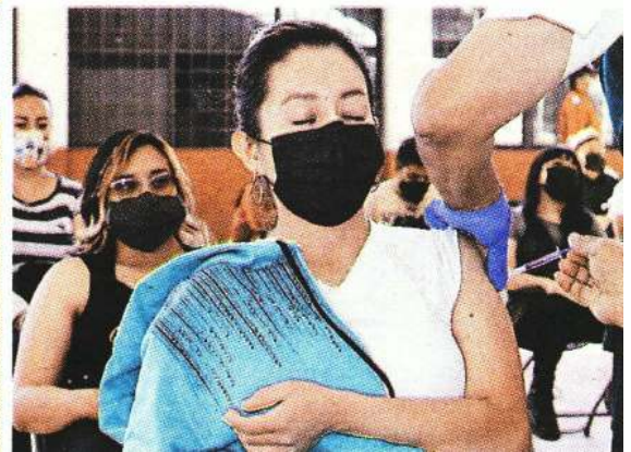
Este miércoles continuó la inmunización de jóvenes en Ecatepec, donde también se atenderá a rezagados. LAURO GALICIA