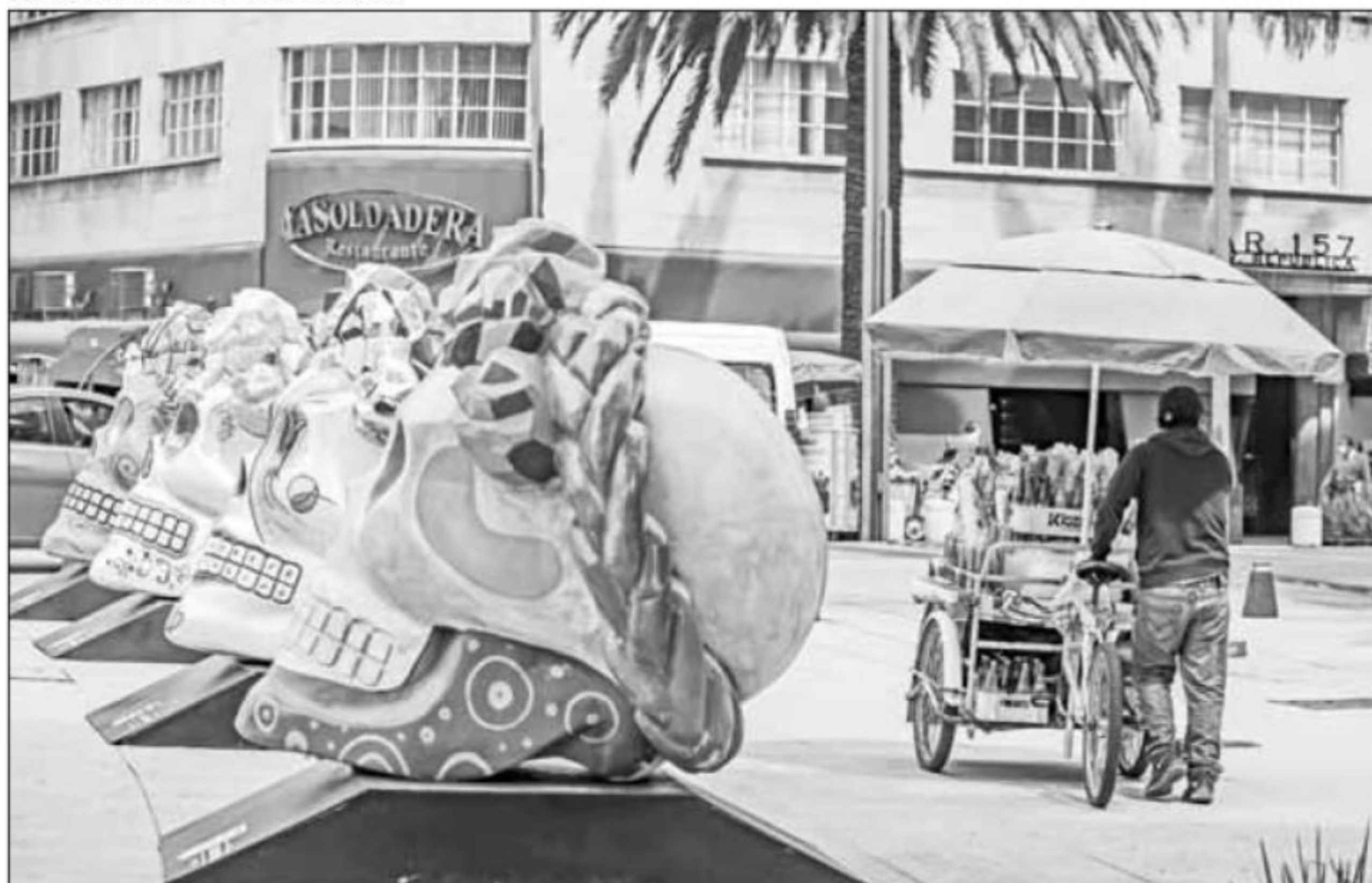
▲ La festividad mexicana más conocida empezó a cobrar vida con la instalación de calaveras gigantes en el Monumento a la Revolución;

además, desde hace un par de semanas se ha plantado flor de cempasúchil en diversas avenidas.