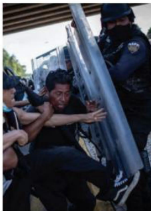
Manifestantes chocan con la policía en Tapachula.

La marcha migrante "por la libertad, la dignidad y la paz"