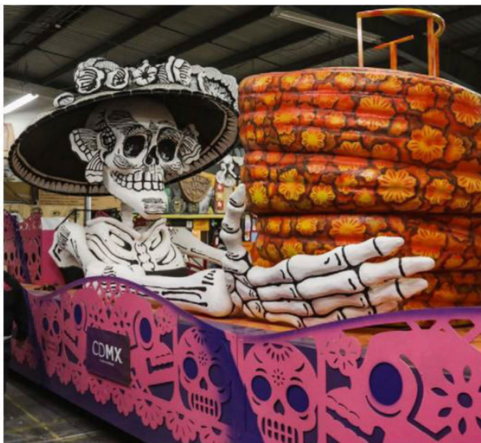
Algunos de los diseños del desfile que se llevará a cabo el 31 de octubre del 2021.