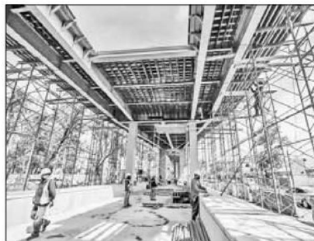
▲ Está previsto que se inaugure la línea elevada de ese medio de transporte para el próximo mes.

Por otra parte, el gobierno local informó que para la reconstrucción y rehabilitación de la línea 12 del Metro sólo contratará a los directores responsables de obras (DRO) y a los corresponsables de seguridad estructural, pero lo demás, desde el proyecto ejecutivo hasta la edificación, estarán a cargo directamente de la empresa Carso.