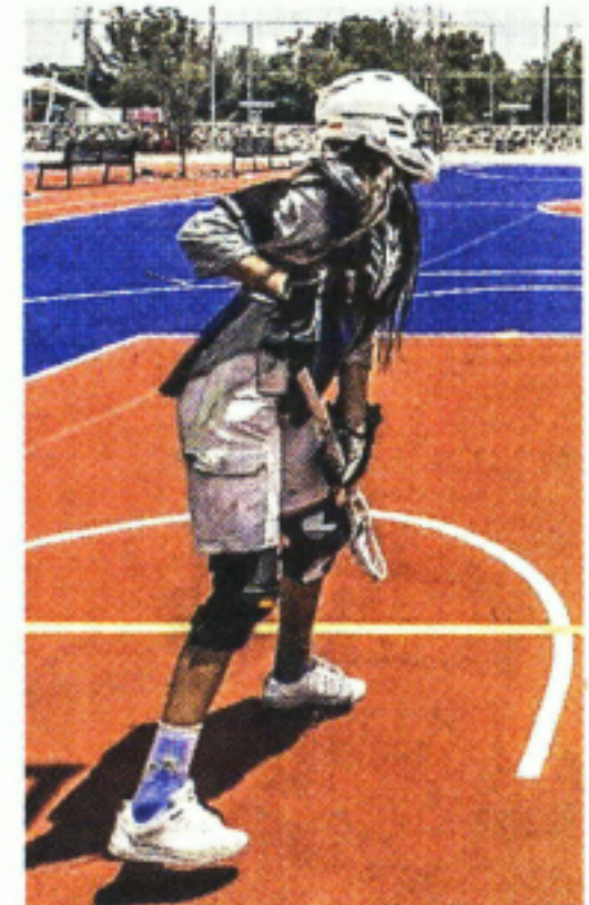
El lugar cuenta con skatepark, espejo de agua y canchas deportivas.

El parque está cerca de la Línea 2 del Cablebús.