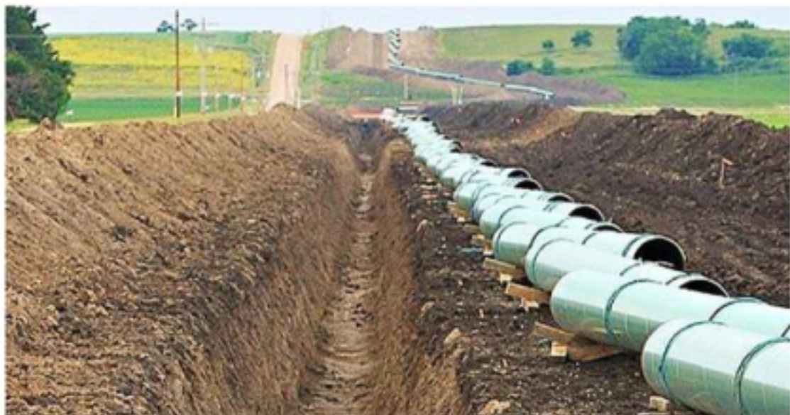
El proyecto de 420 km está frenado en un tramo de 10 km.