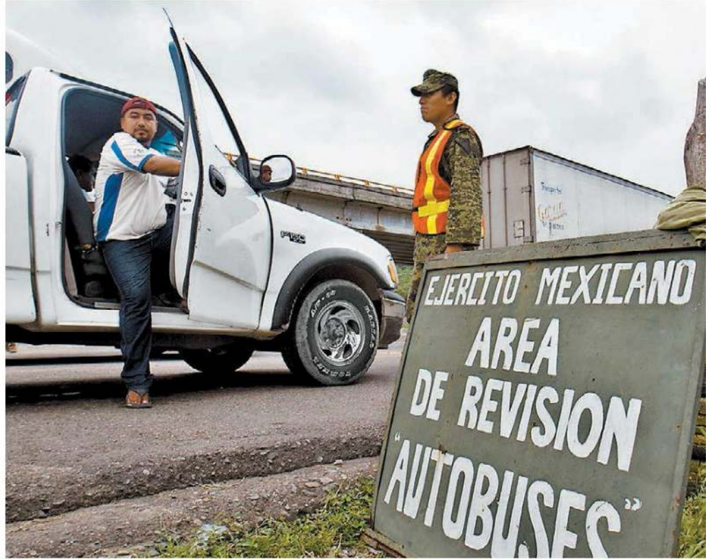
Revisión a cargo de soldados en autopista oaxaqueña .

La primera fase contempla la entrega de las instalaciones, armas y municiones