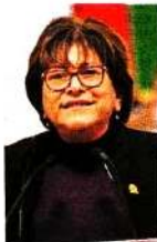
TOMADA DE TWITTER