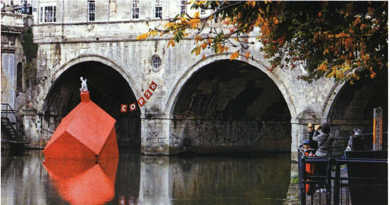
La instalación Casa hundiéndose es obra del estudio de arquitectos Stride Treglown y la firma Format Engineers.

Todas las políticas tienen que estar centradas en la igualdad y la inclusión social, así como en implicar a todos los ciudadanos de forma activa, según los miembros de la comisión, liderada por la primera ministra danesa, Mette Frederiksen.