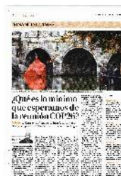
¿Qué es lo mínimo que esperamos de la reunión COP26?

Otra consecuencia es que terminar con la deforestación y comenzar a poner fin a nuestro uso de carbón, en especial en la gene-