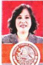
Irma Eréndira Sandoval

:::: Nos comentan que quien al parecer sigue muy molesta con el gobierno de la autollamada 4T es doña Irma Eréndira Sandoval , extitular de la Función Pública.