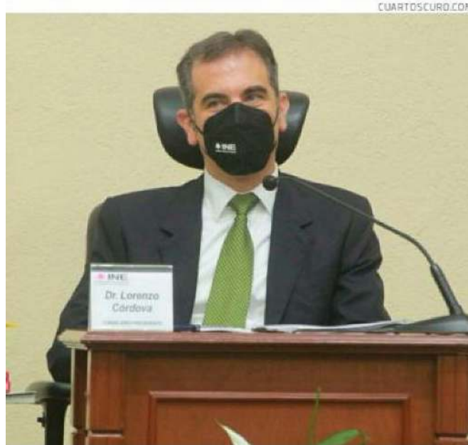
Lorenzo Córdova, presidente del INE, en la sesión extraordinaria.