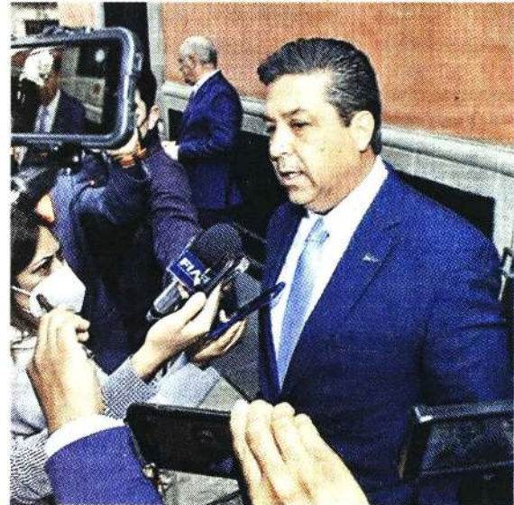
Francisco García Cabeza de Vaca ha enfrentado varias acusaciones del Gobierno federal.