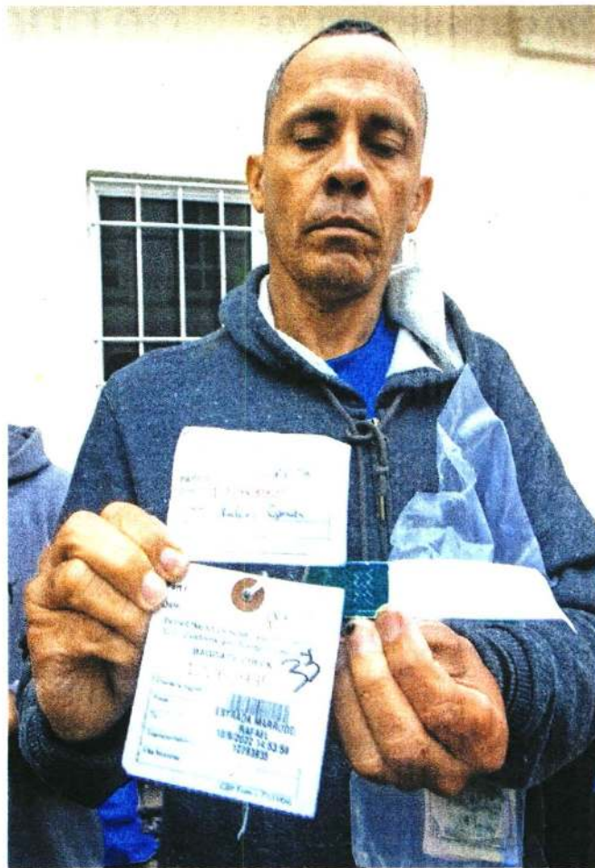
Un migrante venezolano muestra el documento que le dieron las autoridades de EU, en el que se señala que ingresó el 9 de octubre.