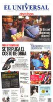
Ilustración: ANI CORTÉS