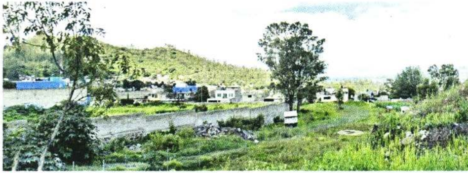
■ Dolores Tlalli, uno de los asentamientos que dejará de tener uso de suelo de conservación.