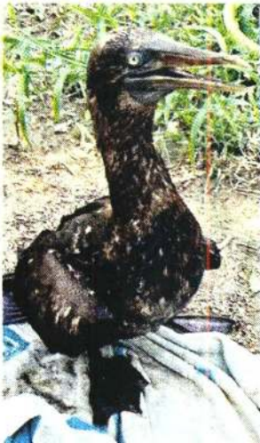
■ Dos pájaros fueron hallados cubiertos de hidrocarburo.