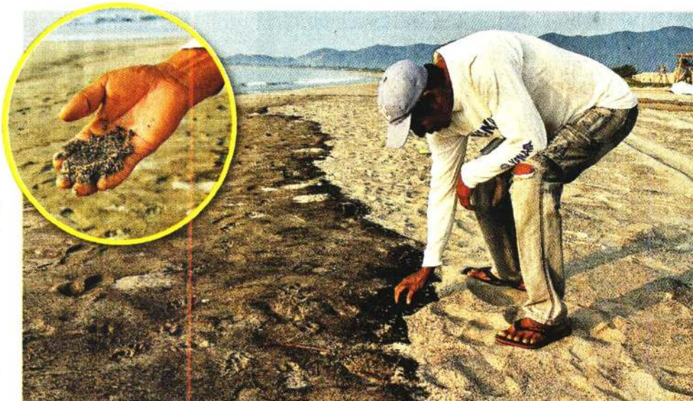
Pescadores denunciaron el derrame de hidrocarburo en playas de Salina Cruz, Oaxaca.