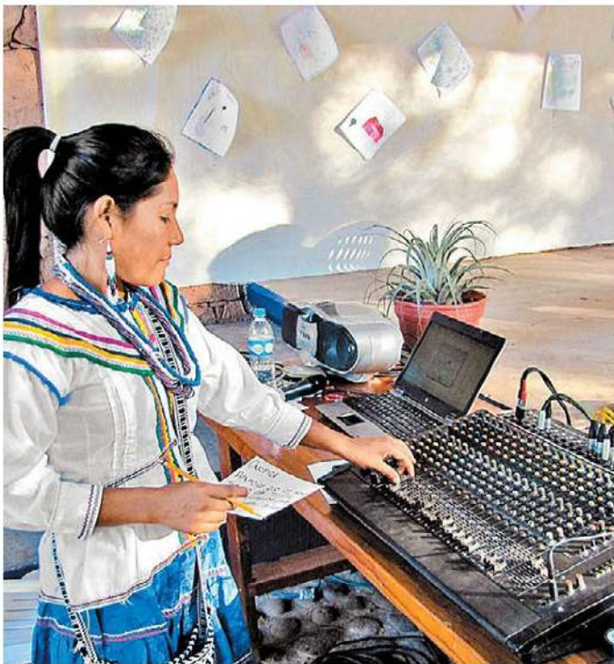
La cifra, similar a la que sí paga impuestos.