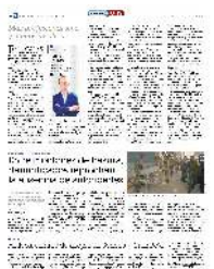
Labor. Miembros del Ejército, al juntar basura en Acapulco.