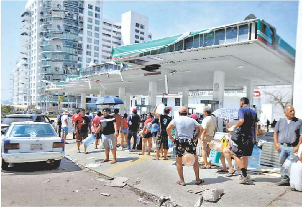
Habitantes del puerto hacen fila para obtener algunos litros de combustible. ARIANA PÉREZ