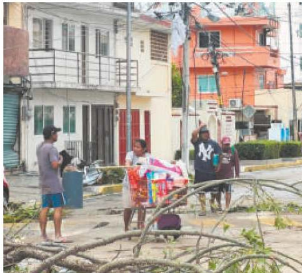
En Acapulco han recurrido a saquear autoservicios