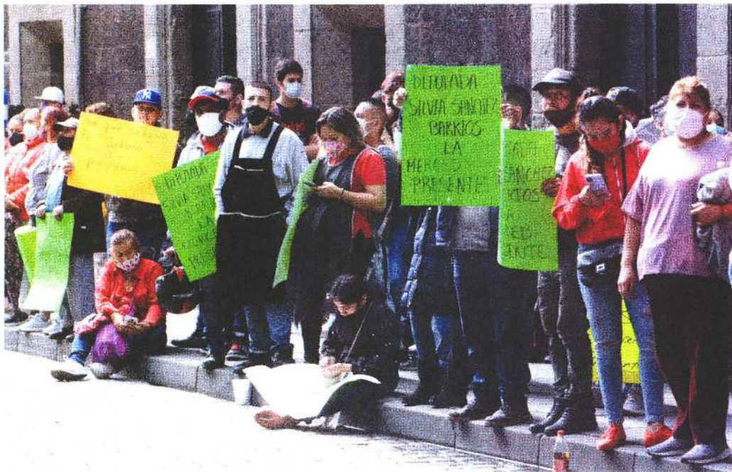
Este 1 de septiembre rindieron protesta 65 de 66 legisladores que conformarán la II Legislatura en el Congreso capitalino. Algunos de ellos cedieron a la tentación de llevar acarreados a la toma.