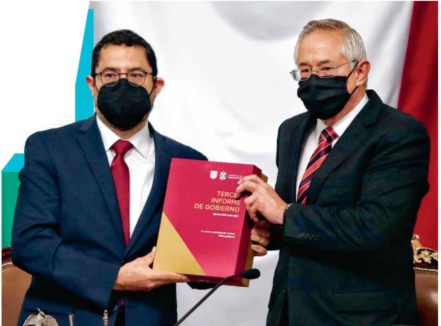
PROTOCOLO | • Martí Batres hizo la entrega oficial del Tercer Informe de Gobierno al diputado Jorge Gaviño.