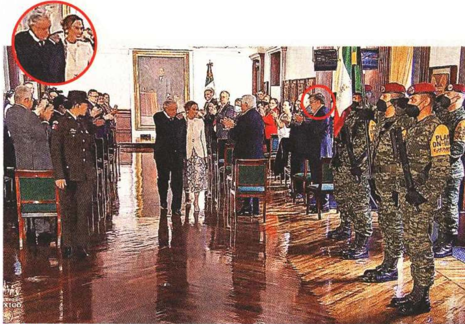
SEÑALES. El Presidente López Obrador expresó ayer en Palacio Nacional muestras de afecto a Julio Scherer Ibarra.