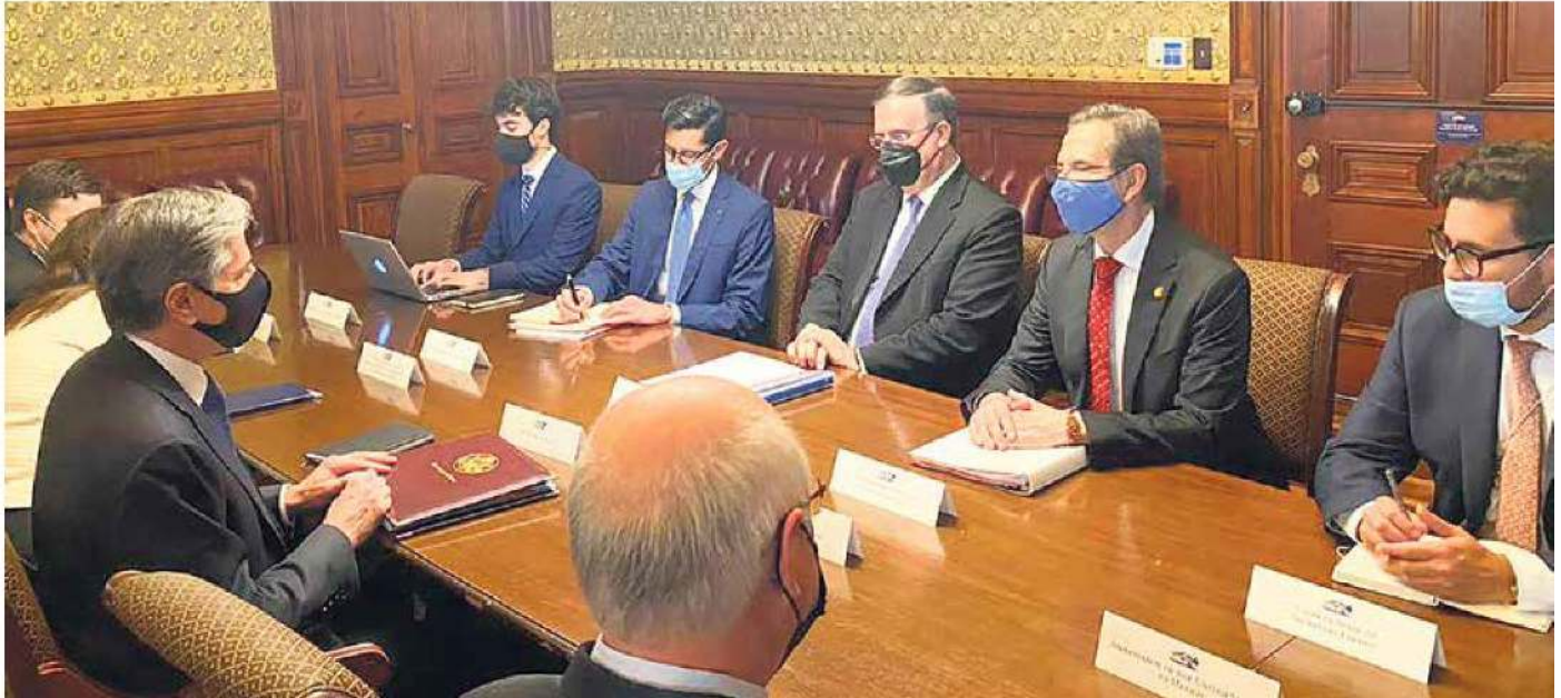
ENCUENTRO. Funcionarios de los gobiernos de México y Estados Unidos, durante el Diálogo Económico de Alto Nivel, en Washington, DC.