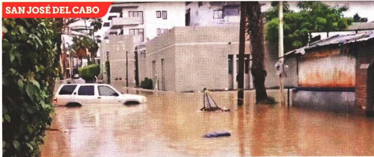
EFFECTOS. Antes de su impacto en Los Cabos, el ciclón dejó inundaciones en la zona centro de la localidad.