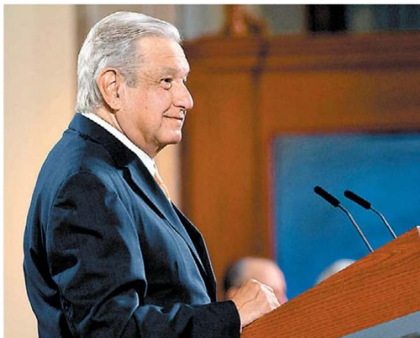
El mandatario durante la conferencia mañanera. ESPECIAL

• FUENTE: PPEF 2022 • INFORMACIÓN: Rafael López • GRÁFICO: Juan Carlos Fleicer