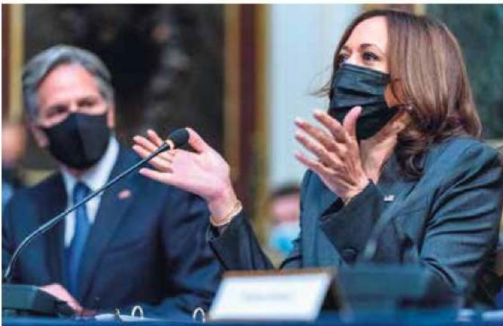
REPRESENTANTE. La vicepresidenta de EU, Kamala Harris, durante la reunión.

La carta fue encabezada por el senador Bob Menéndez, el latino de más alto rango en el Congreso, y la congresista demócrata Verónica Escobar