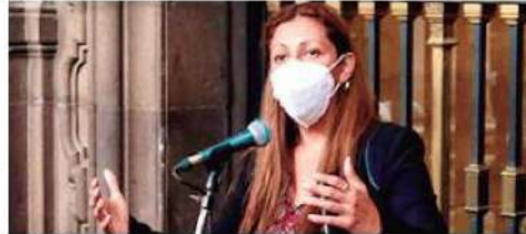
Utilizó programas sociales de la alcaldía.

La también exdiputada local, quien el pasado 31 de agosto concluyó su periodo legislativo en el Congreso de la Ciudad de México, también fue impugnada ante el Tribunal Electoral por actos anticipados de precampaña y campaña, el uso indebido de recursos públicos y violación a las reglas sobre difusión de informes de labores, a través de diversas publicaciones en redes sociales y la pinta de bardas en la demarcación Venustiano Carranza.