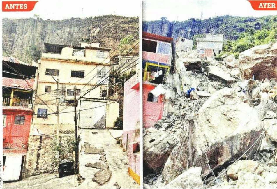
■ Vecinos aseguraron que habían reportado las condiciones del cerro tras las recientes lluvias.