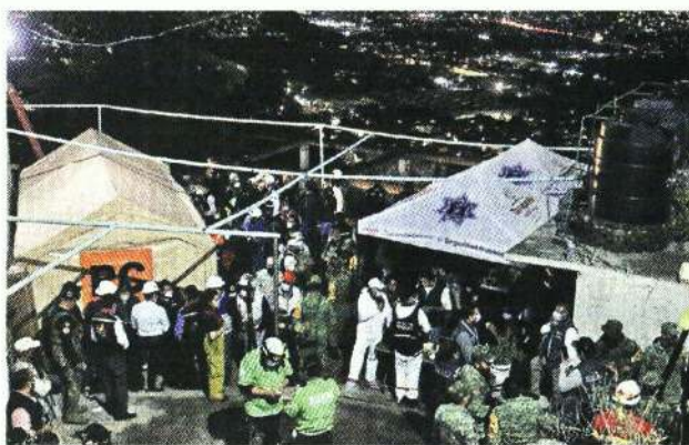
■ Las operaciones de búsqueda se mantuvieron hasta la noche; 10 personas seguían desaparecidas.