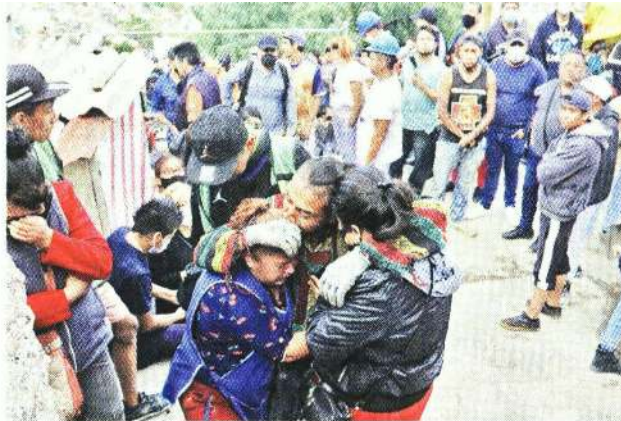
■ Habitantes esperaban entre angustia y desesperación.