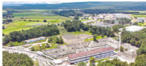
Después de su planta potabilizadora, el sistema Cutzamala sólo tiene una línea de conducción del agua hacia la metrópoli.

Además de los efectos de la sequía, el suministro de agua a través del Sistema Cutzamala es vulnerable a una falla súbita porque, a partir de la planta potabilizadora Los Berros, sólo tiene una línea de conducción hacia la capital del País. Un estudio del Instituto Mexicano de Tecnología del Agua (IMTA), advierte que una falla estructural en el acueducto, ya sea súbita y durante los trabajos de mantenimiento, obligaría a un paro completo del sistema que surte a la CDMX y a Toluca. “A partir de la planta de Los Berros (potabilizadora), el sistema no tiene redundancia ni flexibilidad, ya que sólo cuenta con una línea de conducción entre la planta de bombeo 5 y la Torre de Oscilación”, subraya el análisis. El Cutzamala se compone de siete presas con canales hacia la potabilizadora y un