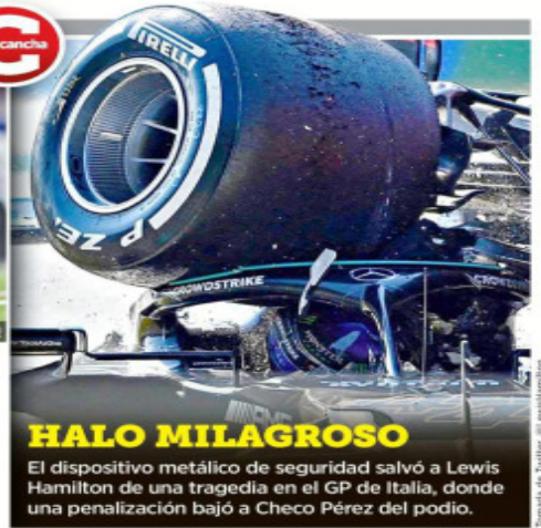
Escuadra de Mercedes