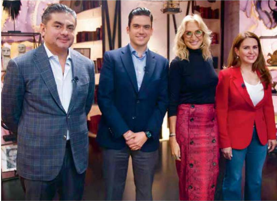
• DEBATE. Diputados representantes del bloque opositor, ayer en el estudio de Heraldo Televisión.