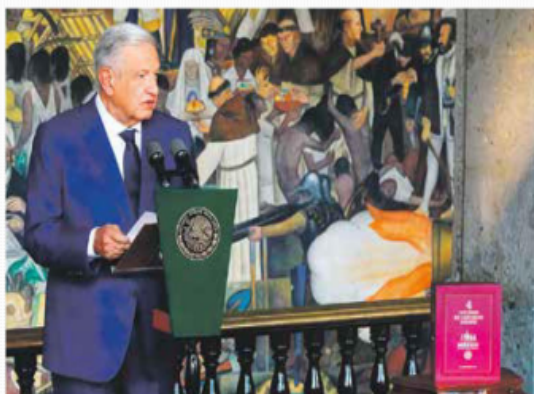
'TRIUNFARÁ LA 4T'. Frente a él, sus tres 'corcholatas' escucharon su mensaje.