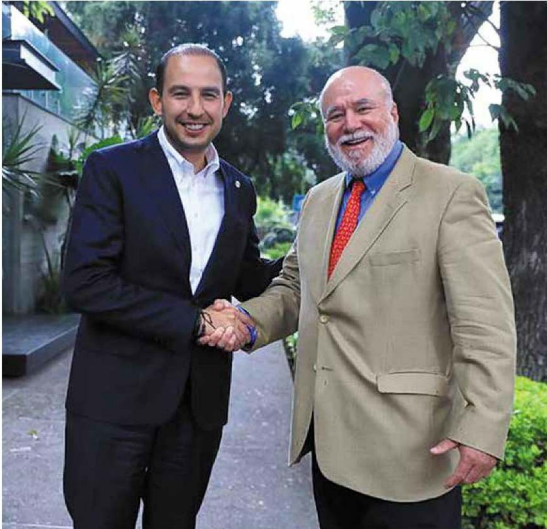
SALUDO. El líder nacional del PAN, Marko Cortés, y Manuel Clouthier, ayer.