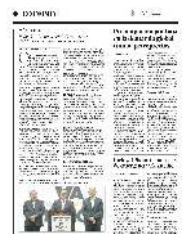
respectivamente, partidos que integran la alianza Va por México.