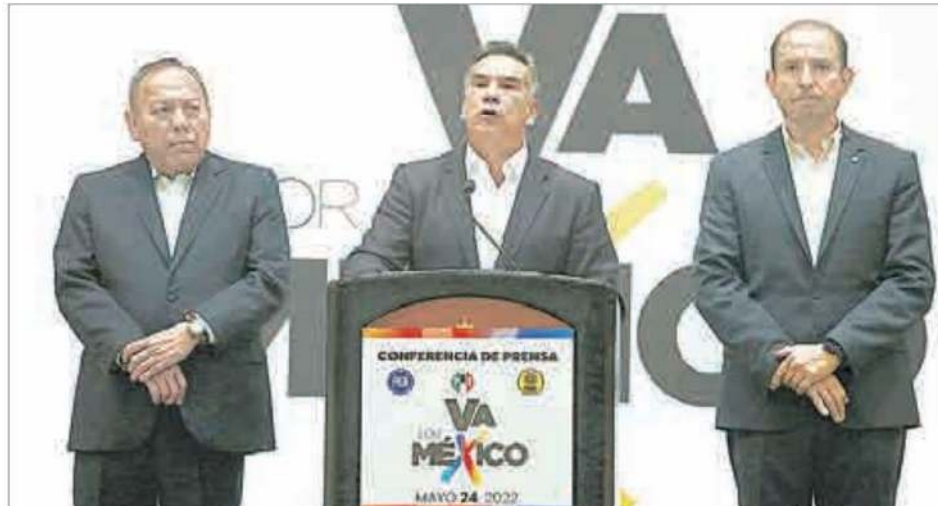
▲ Jesús Zambrano, Alejandro Moreno y Marko Cortés, líderes nacionales de PRD, PRI y PAN,