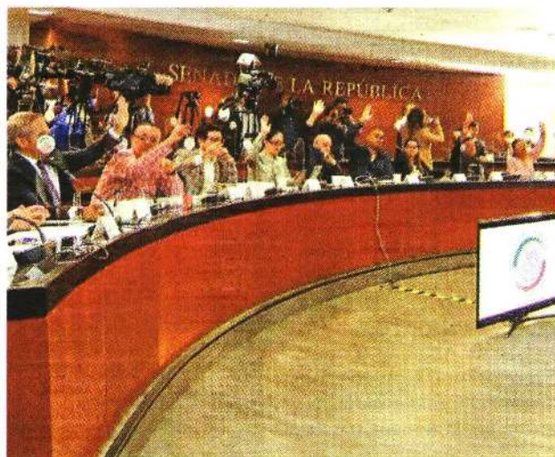
La mayoría de Morena y sus aliados aprobaron en comisiones del Senado la reforma sobre la Guardia Nacional.

En la Comisión de Justicia, el dictamen fue aprobado con nueve votos en favor y ocho en contra; en Estudios Legislativos Segunda, con nueve en favor y cinco en contra.