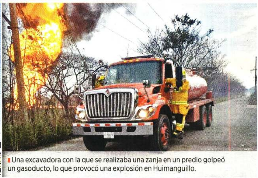
Una excavadora con la que se realizaba una zanja en un predio golpeó un gasoducto, lo que provocó una explosión en Huimanguillo.