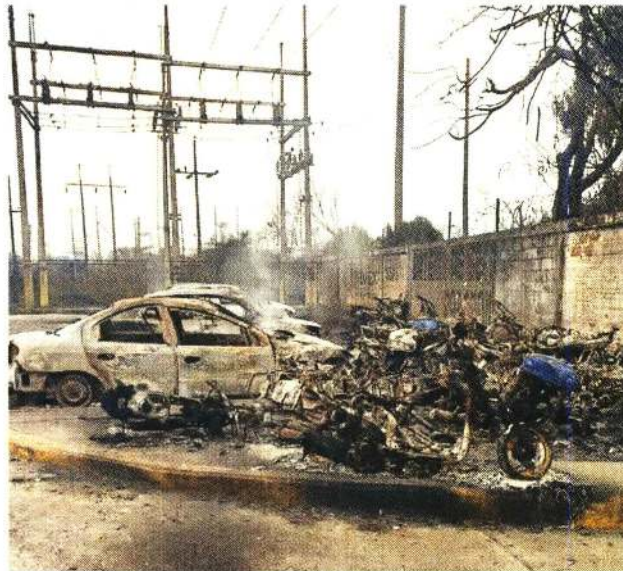
Al menos seis autos que estaban frente a la planta de Pemex se incendiaron por el siniestro.

8,018 kilómetros sólo de gasoductos opera Petróleos Mexicanos en el País.