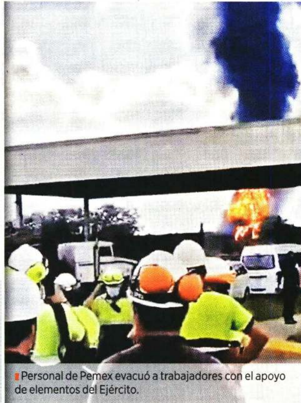
Personal de Pemex evacuó a trabajadores con el apoyo de elementos del Ejército.