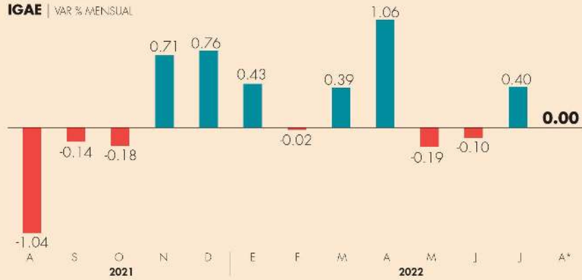
IGAE | VAR % A MENSUAL

El Indicador Oportuno de Actividad Económica tuvo un crecimiento nulo en agosto, lo que a decir de analistas arroja señales de una desaceleración en la recuperación económica que se había logrado en julio, luego de las caídas en mayo y junio.