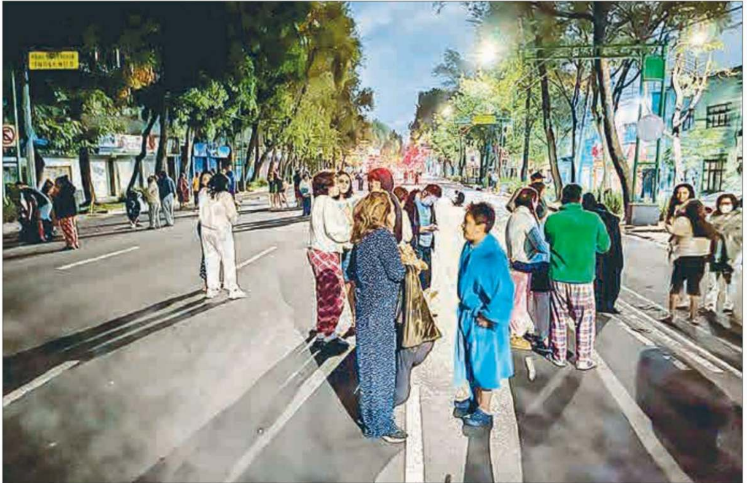
▲ A pesar del susto y los nervios provocados por la réplica sísmica de magnitud 6.9 registrada en la madrugada del jueves, cientos de capitalinos evacuaron sus viviendas en pijamas y hasta en ropa interior.