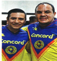
Ulises Bravo y su hermano Cuauhtémoc Blanco.

—Le dije al Gobernador", responde Uchida. "Si hay condiciones (para crear la notaría), pero te pido dos favores: Yo lo opero, yo hago todo. Porque me dijo: '¿Te encargas?'. Le dije (a Cuauhtémoc Blanco): 'Si, me encargo, pero dos favores: habla con Pablo (Ojeda) y ayúdame a