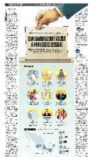
Ilustración: Horacio Sierra y Abraham Cruz / Gráfico: Erick Retana