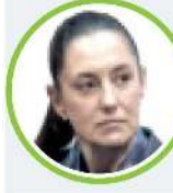
CLAUDIA SHEINBAUM PARDO (Candidatura común Juntos Haremos Historia) 2018