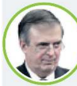
MARCELO EBRARD CASAUBON (Coalición Por el Bien de Todos) 2006