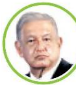
ANDRÉS MANUEL LÓPEZ OBRADOR (Alianza por México) 2000