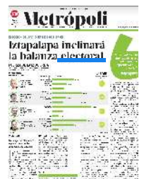
Gráfico: Daniel Rey