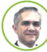
MIGUEL ÁNGEL MANCERA ESPINOSA (Candidatura común PRD, PT y MC) 2012