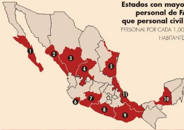
Estados con mayor personal de FA que personal civil | PERSONAL POR CADA 1,000 HABITANTES

En 11 entidades, la mayoría gobernadas por Morena (10), la tasa de personal de Fuerzas Armadas (FA) en tareas de seguridad es mayor a la del personal civil.