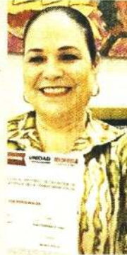
Tabasco. Senadora Mónica Fernández.