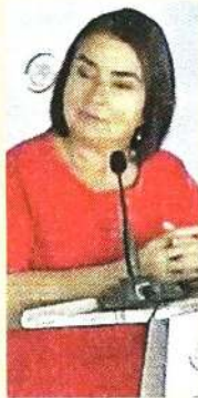
Guanajuato. Antares Vázquez, senadora.