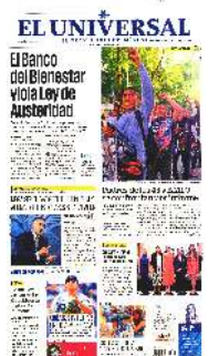
Pancartas y consignas acompañaron la marcha por el noveno aniversario de la desaparición de los estudiantes.